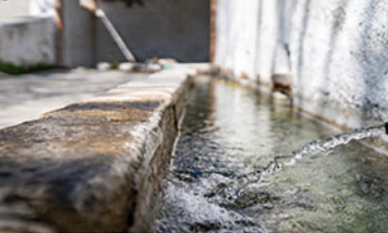
Sendero de las Minas de Talco