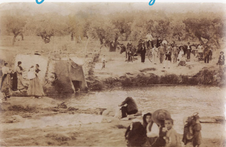
Baños de Cella (Zúola) Baños

La elección por antiguos pobladores del enclave para construir sus viviendas, estaba asociado sin lugar a dudas a motivos defensivos y a su riqueza en agua, tierras de pastos y cultivos. Lúcar cumplía al menos esos cuatro requisitos. Han sido diversas fuentes las que desde tiempos inmemoriales han regado su huerta, teniendo especial relevancia su nacimiento artesiano de aguas termales en la barriada de Cella. Existe una losa de época romana con una inscripción en la que consta que se realizaron unos juegos romanos para conmemorar la creación de las termas.